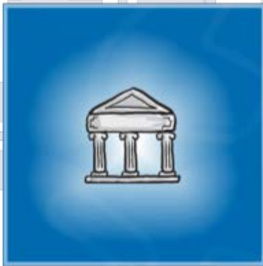
Obrazovanje i obuke

Erasmus+ je program Evropske unije koji obezbeđuje finansiranje projekata za saradnju u tri oblasti: